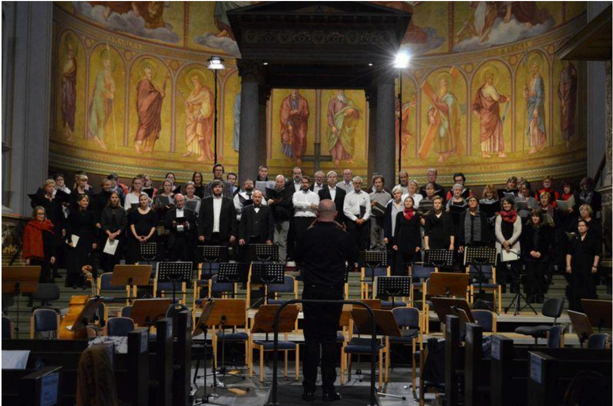
A nagy kórus (a németekkel együtt)