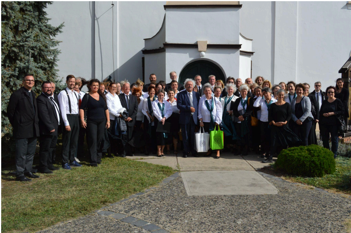
Csoportkép a templom előtt