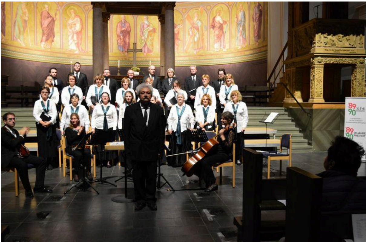
Csak a Lutheránia