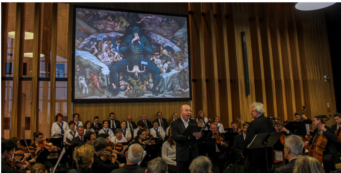
A MÜPA üvegtermében 2015. január 24-én (BWV 81 kantáta)