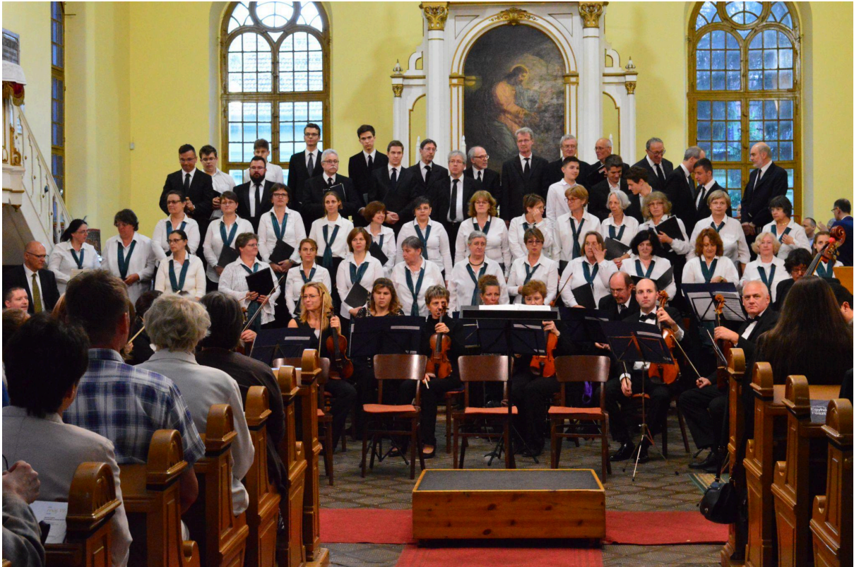
Békéscsabán 2018. május 19-én