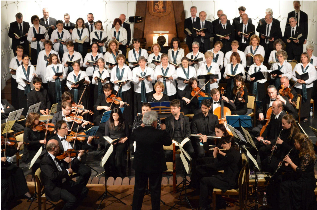
A zalaegerszegi h-moll mise

A "Zenei hitvallásaink" sorozatban nem jutottunk el Zalaegerszegre, de kaptunk egy meghívást a helyi hangverseny szervezőktől, hogy 2017. október 28-án a Zalaegerszegi Hangverseny- és Kiállítóteremben adjuk elő a h-moll misét. Ennek az előadásnak a finanszírozása természetesen nem a sorozatra elkülönített állami keretből történt, hanem a zalaegerszegiek saját költségvetéséből.