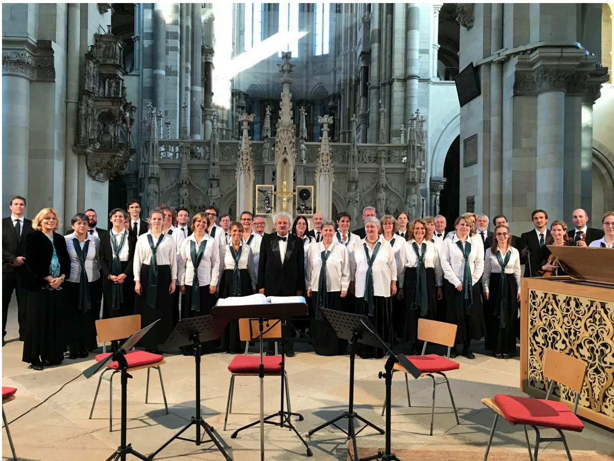
A magdeburgi dómban

Másnap reggel énekeltünk a dómban az istentiszteleten, majd egy ebéd elfogyasztása után hazautaztunk.