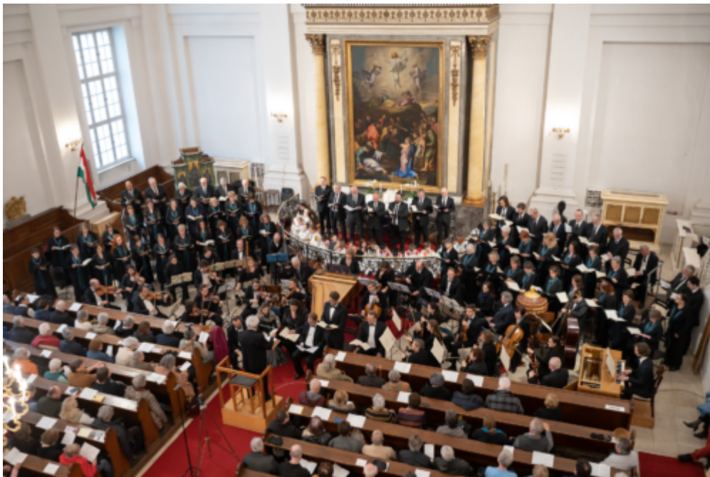
St Matthew Passion in Deák Square Lutheran church