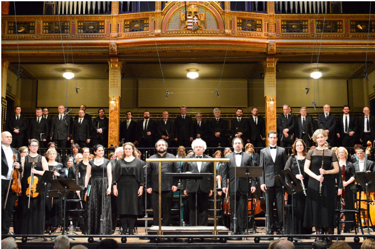
Fogadjuk a tapsot