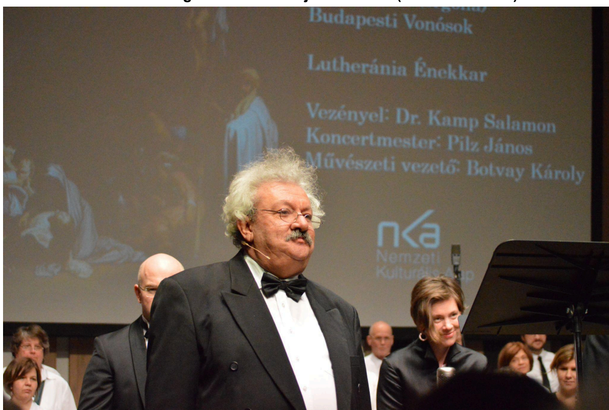
2018. március 3-án a BMC-ben (János passió)