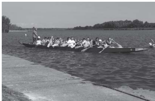
Kicsik és nagyok összehangolt evezőcsapásai repítették a sárkányhajót Domboriban.