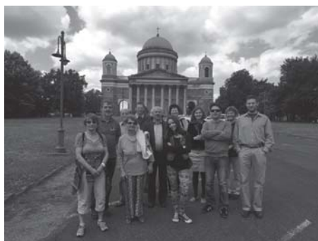
Eberni barátainkkal Esztergomba is ellátogattunk egy kirándulás erejéig.